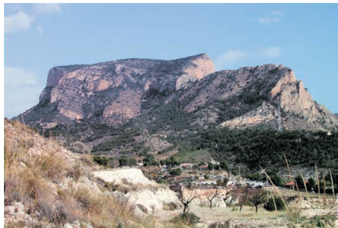
Alto de la Silla del Cid, Petrer